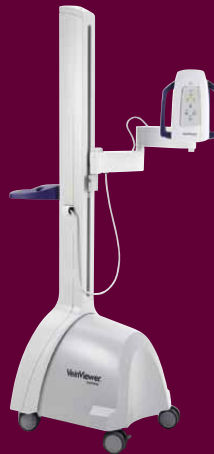
VeinViewer GS starší typ