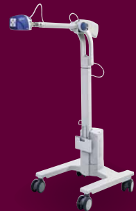
VeinViewer Vision nový model